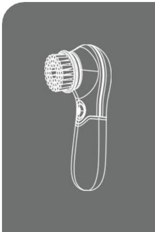
ROTARY FACIAL CLEANSER SET